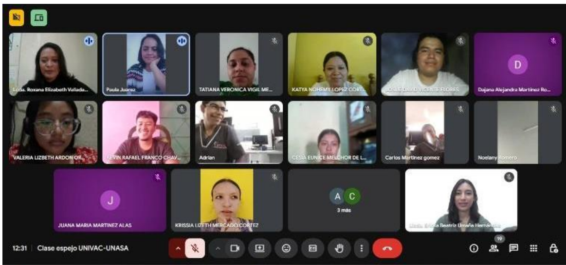
Figura 1. Sesión de Clase Espejo

Nota: sesión de Clase Espejo UNIVAC-UNASA. Fotografía tomada por el autor 2026.